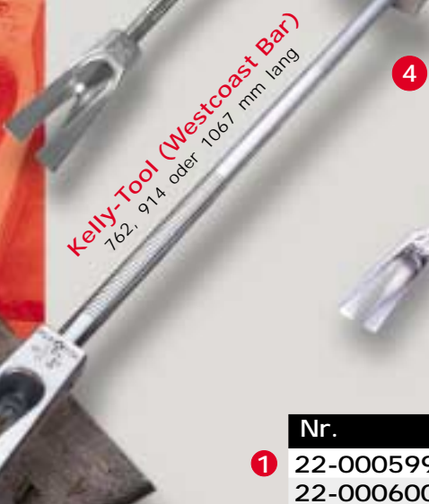
Kelly-Tool (Westcoast Bar) 762, 914 oder 1067 mm lang