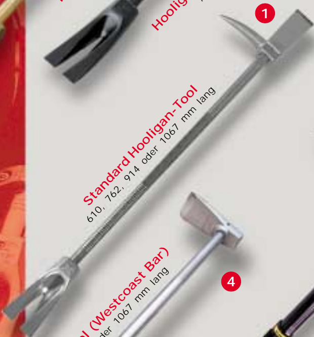
Standard Hooligan-Tool 610, 762, 914 oder 1067 mm lang