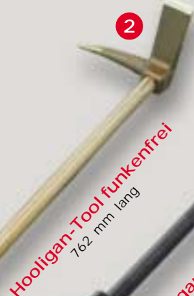
Hooligan-Tool funkenfrei 762 mm lang

Schweres Werkzeug für Ihre schwierigsten Aufgaben !