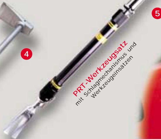
PRT-Werkzeugsatz mit Schlagmechanismus und Werkzeugeinsätzen