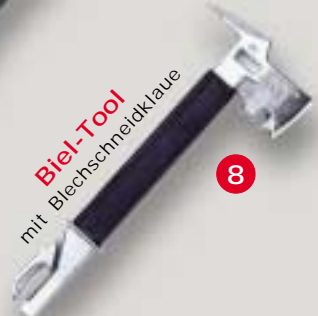
Biel-Tool mit Blechschnidklaue