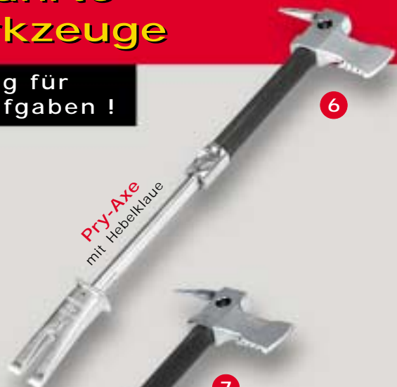
Pry-Axe mit Hebelklaue