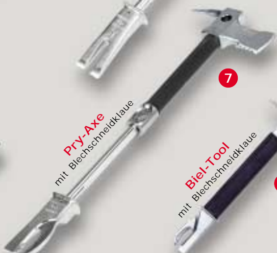
Pry-Axe mit Blechschnidklaue